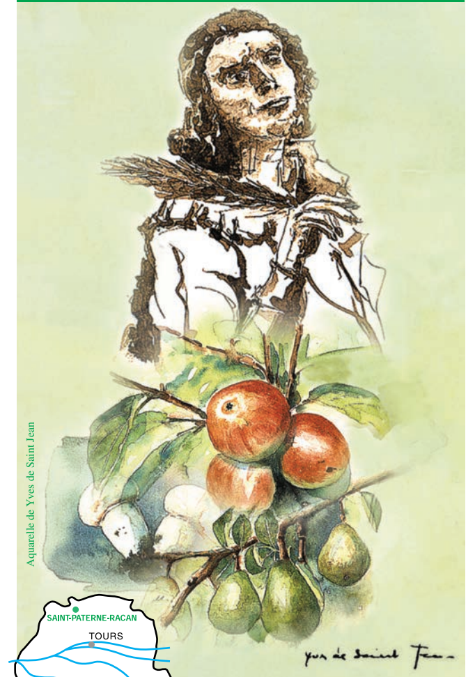
Aquarelle de Yves de Saint Jean